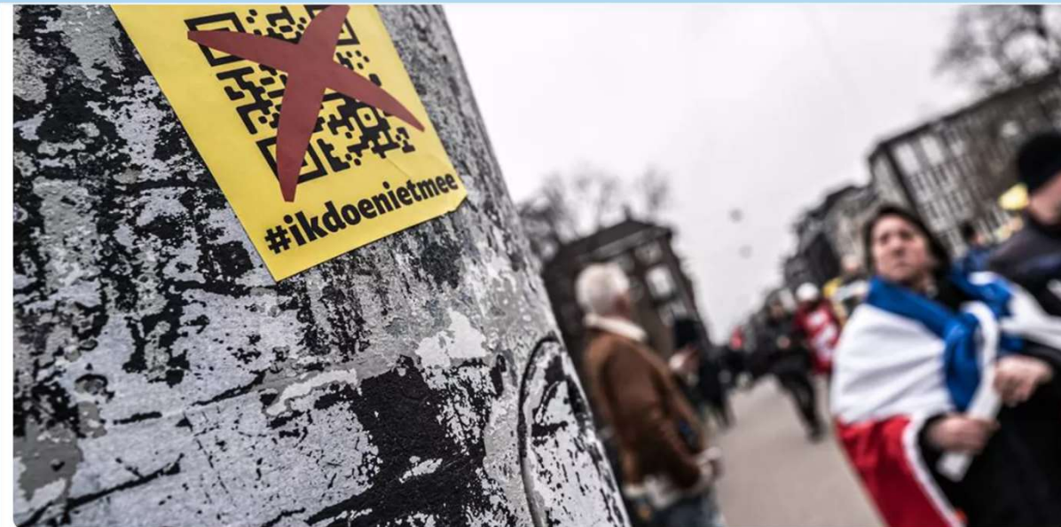
Soevereine beweging Nederland