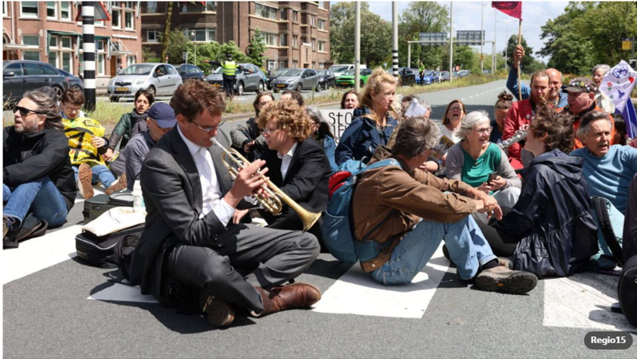
Actievoerders van Extinction Rebellion op de A12 tijdens een eerdere blokkade